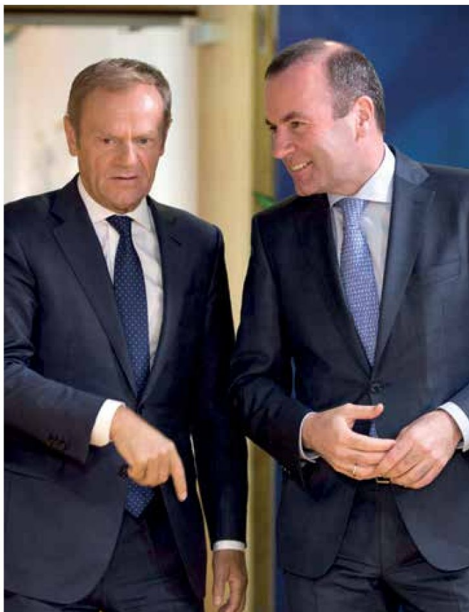
Donald Tusk, az EPP elnöke és Manfred Weber frakcióvezető