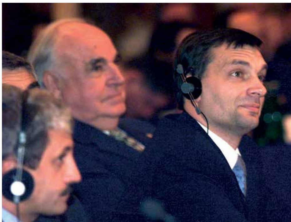
Orbán Viktor miniszterelnök Mikuláš Dzurinda szlovák kormányfővel és Helmut Kohllal, a CDU korábbi elnökével az Európai Néppárt berlini kongresszusán 2001 januárjában