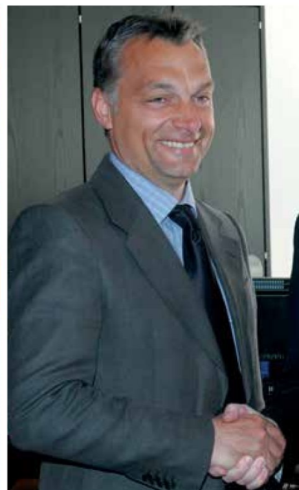
Magyarország nagy barátja, Wilfried Martens, az EPP korábbi elnöke és Orbán Viktor Brüsszelben 2007-ben

Végéhez közeledik a Fidesz és az Európai Néppárt több mint húszéves kapcsolata: múlt héten a magyar kormánypart kilépett az EPP európai parlamenti képviselőcsoportjából, miután a néppárti frakció elfogadta alapszabályának módosítását, amelynek értelmében már nemcsak egyes képviselőket, hanem csoportjaikat is ki lehet zárni, illetve fel lehet függeszteni. Változás, hogy amennyiben a pártcsalád már kizárta vagy felfüggesztette az érintett pártot, a képviselők csoportjával szembeni lépéshez elegendő az egyszerű többséget igénylő frakciódöntés – ez az a kritikus pont, ami miatt nehéz nem úgy értelmezni a döntést, hogy a Fideszre lett szabva. A Fidesz tagsága ugyanis éppen fel van függesztve. A szavazók több mint 84 százaléka a változtatás mellett döntött. Milyen folyamat vezetett a szakításhoz? Távozik-e a Fidesz a pártcsaládból is? Mi vár az európai jobboldalra? A Mandiner politikusok és elemzők segítségével tárta fel a néppártügy hátterét.