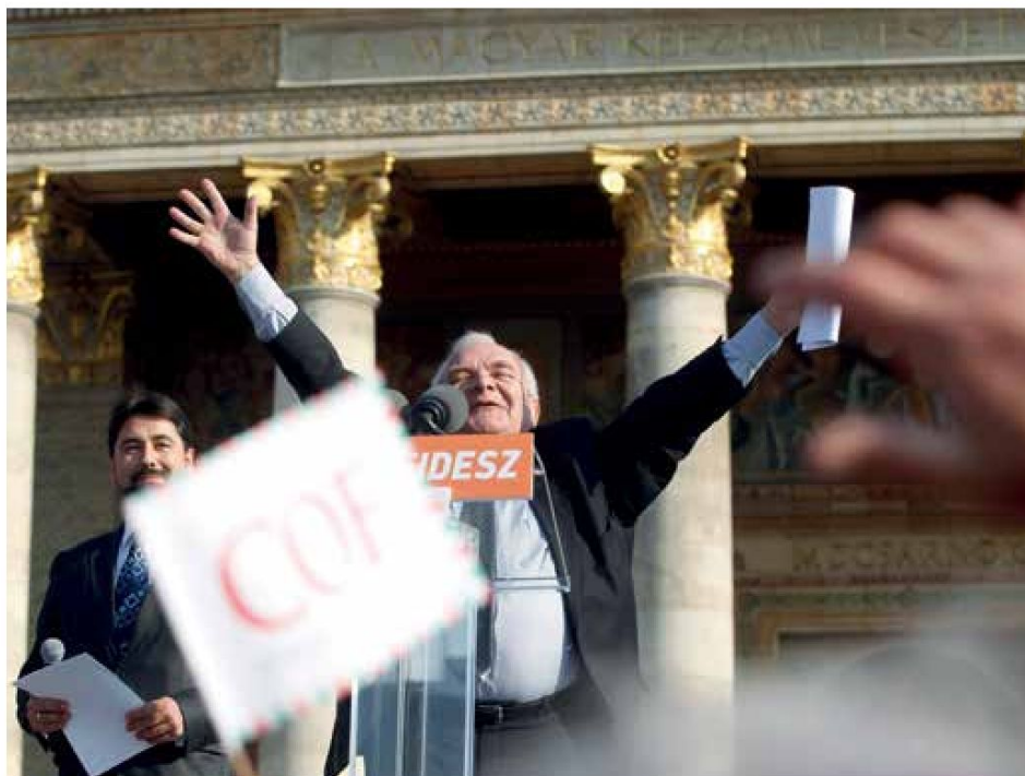
Joseph Daul, az Európai Néppárt elnöke kampányol a Fidesz–KDNP nagygyűlésén a Hősök terén 2014. március 29-én

Szövetséget kötött a hagyományos, kontinentális kereszténydemokraták és az északi konzervatívok között, offenzív bővítési politikájával bevonta a volt kommunista országok keresztény, jobboldali, nemzeti irányultságú pártjait az EPP-be – sorolta a Fidesz elnöke.