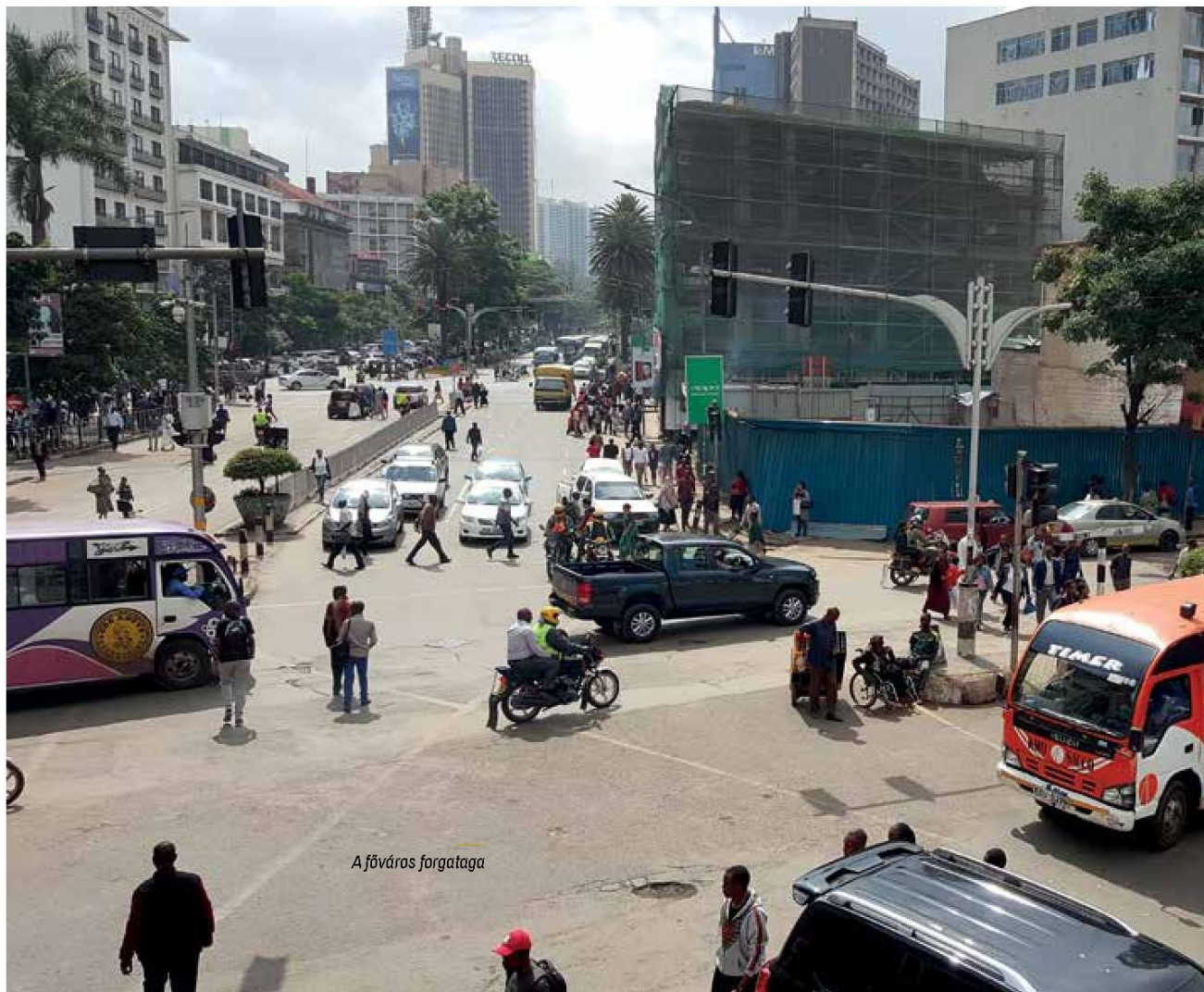
A főváros forgataga

Azért Nairobiban sem árt az óvatosság: a terroristaellenes készültség folyamatosan magas szinten van, és minden épületbe lépést biztonsági átvizsgálás előz meg – bár ennek hatásfoka épp a napi rutin miatt meglehetősen vegyes. Az a fokozott nyugati izgalom azonban, amely időnként a kenyai terrorhelyzetet övezi, mindenképp túlzó: az ide látogató turistának nagyságrendekkel nagyobb esélye van meghalni közlekedési balesetben, mint merényletben. Úgyhogy mindig csatoljuk be a biztonsági övet, és ne feledjük, a járdáról való lelépés előtt itt először nem balra, hanem jobbra kell nézni.